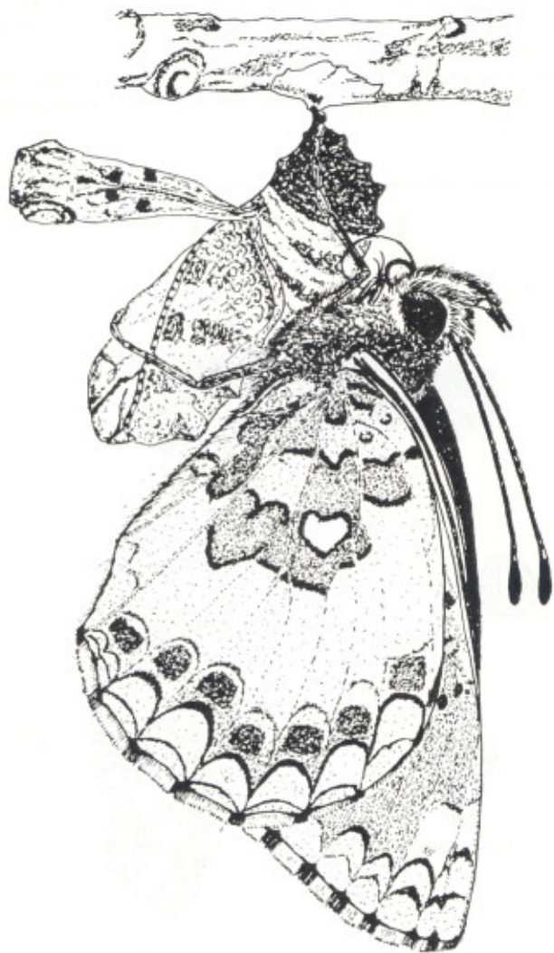
Representación artística del ejemplar aberrante descrito