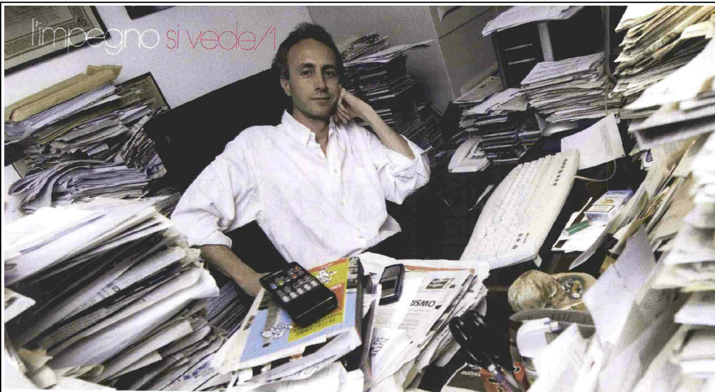
Marco Travaglio nel suo studio. Il giornalista è nato a Torino nel '64.